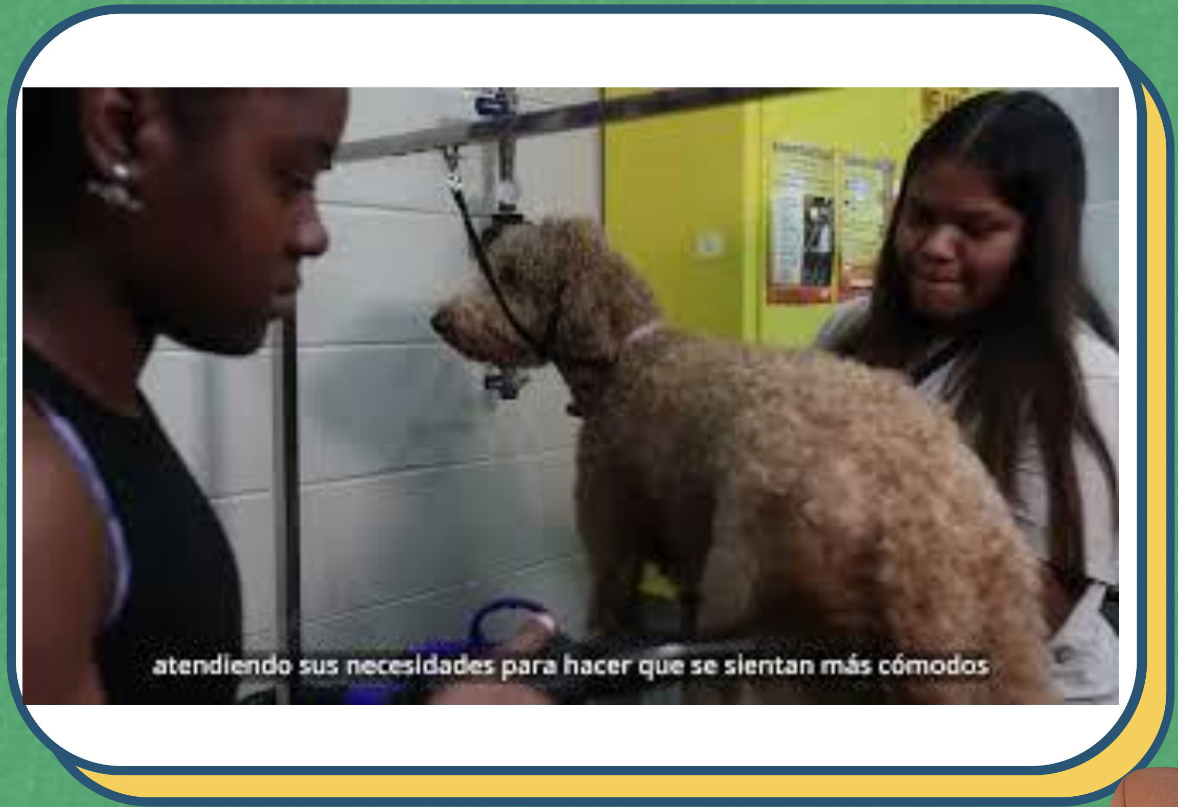
atendiendo sus necesidades para hacer que se sientan más cómodos